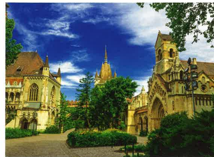
Modernisiert wird derzeit auch der Stadtpark Városliget in Budapest

Gebäude und Grünflächen, die einst abgerissen wurden, werden renoviert. Der Stephanssaal und die dazugehörige Ausstellung „Hauszmann Story“ über die Er-