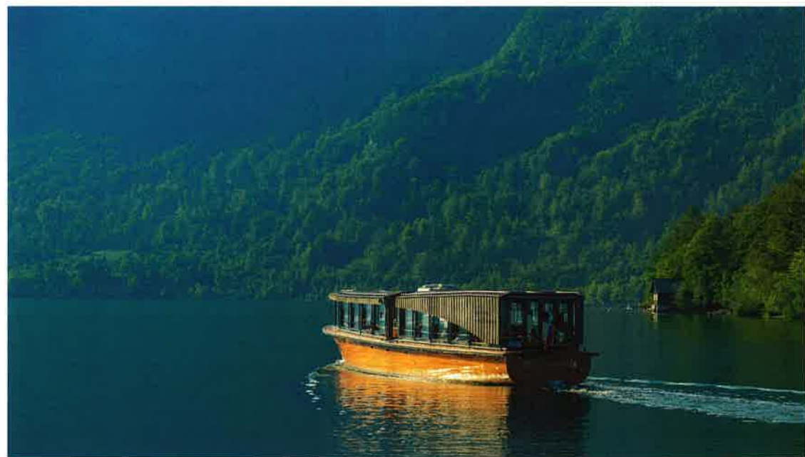
Der Bohinjer See im Nationalpark Triglav ist der größte natürliche See Sloweniens. Hier bietet sich eine Fahrt auf dem Panoramboot an