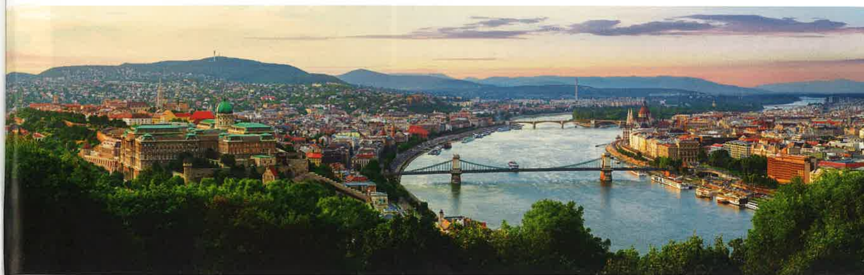
Mit seinen Welterbestätten und seinem Panorama bietet Budapest die perfekte Kulisse