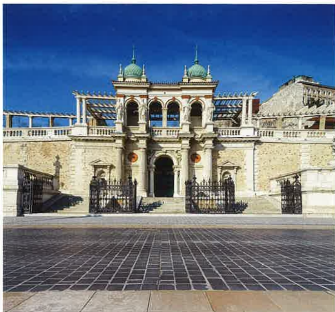
Veszprém in Ungarn, seit 2019 UNESCO-Stadt der Musik, ist Kulturhauptstadt Europas 2023 In die grüne Oase Budapests, den Burggartenbasar, locken viele Veranstaltungen

neuerung des Burgviertels, die am 20. August 2021 eingeweiht wurden, haben bereits über 100.000 Besucher angezogen. Nach seiner Zerstörung im Zweiten Weltkrieg haben Experten und Künstler im Rahmen des Nationalen Hauszmann-Programms jahrelang an der Wiederherstellung des Saals gearbeitet.