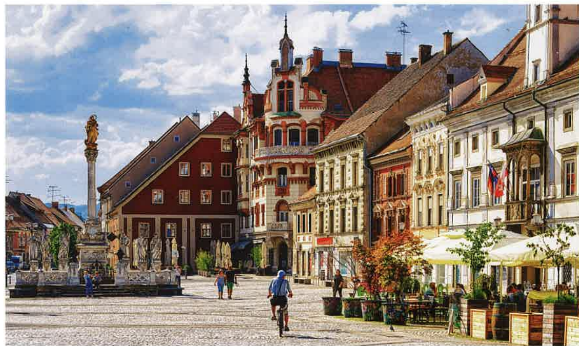
Maribor ist laut der Abstimmung auf der Website „European Best Destinations“ eines der Top-3-Reiseziele in Europa